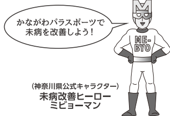
(神奈川県公式キャラクター) 未病改善ヒーロー ミエビョーマン