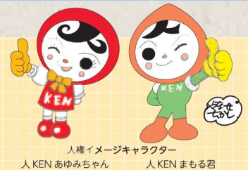
人権イメージキャラクター 人KEN あゆみちゃん 人KEN まるる君

主催: 神奈川県人権啓発活動ネットワーク協議会(構成員: 神奈川県、横浜地方方法務局、横浜市、川崎市、相模原市、横須賀市、神奈川県人権擁護委員連合会)、平塚市、神奈川県